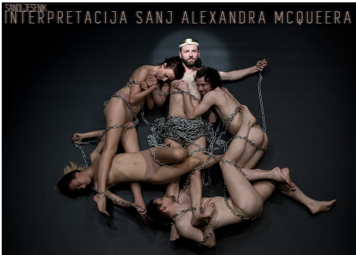
Slika 12 (Plakat predstave)